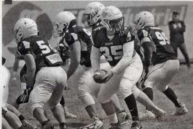
BÚHOS TAMPICO dominó la primera parte del partido.

ron importantes para los tampliqueños ya que lograron los puntos necesarios para la ventaja, al medio tiempo se fueron con el triunfo de 14-6, una ventaja que no soltarían.