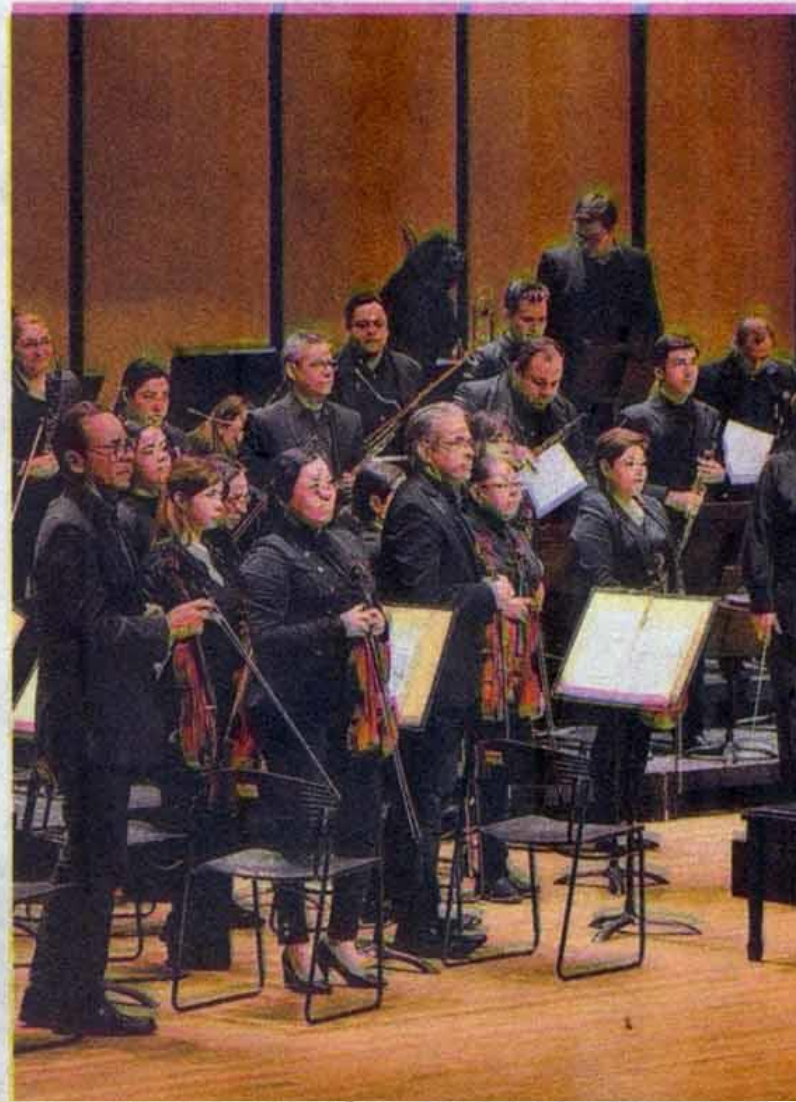
OSUAT ofrecerá su cuarto concierto de la temporada en homenaje a la mujer / CARMEN JIMÉNEZ

Este concierto tendrá lugar el Aula Magna "H.H. Fleishman" y dará inicio en punto de las 8:00 pm, la entrada es libre sin bofeto.