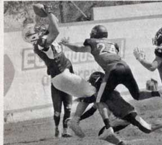
BUEN TRABAJO ofensivo y defensivo.

Para la segunda parte del cotejo los fronterizos encontraron el camino pero no fue suficiente para empatar mínimo el duelo y fue así como los visitantes se quedarían con la victoria y por ende con