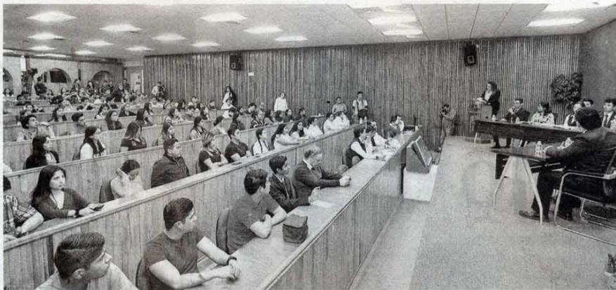
El evento es organizado por la Universidad Autónoma de Tamaulipas (UAT) a través de la Dirección de Participación Estudiantil de la Secretaría de Gestión Escolar.