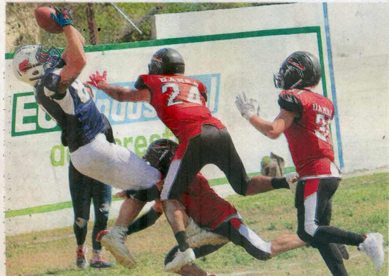
EXCELENTE atrapada del ovoide en una de las ofensivas de los "Búhos" que vencieron a Búfalos" y se proclamaron campeones