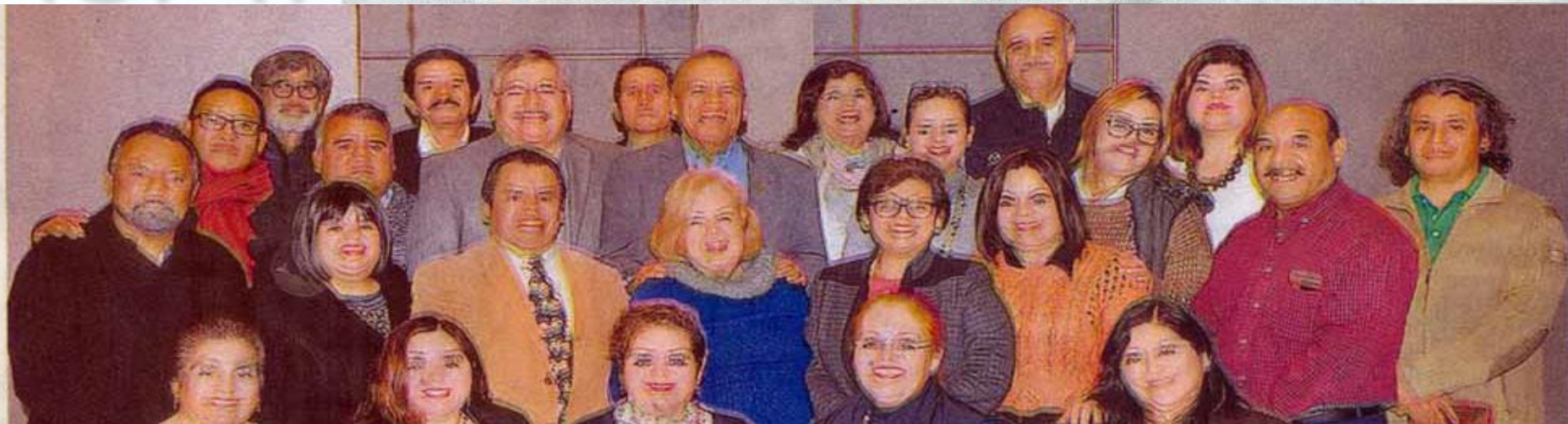
En su convivio maestros de la Facultad de Derecho y Ciencias Sociales de la UAT