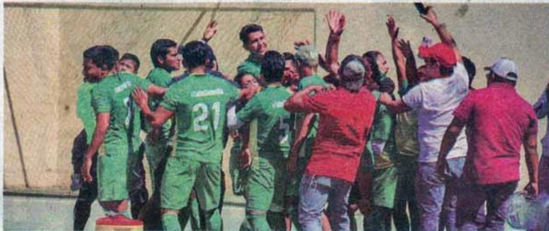
El festejo de los Vaqueros.