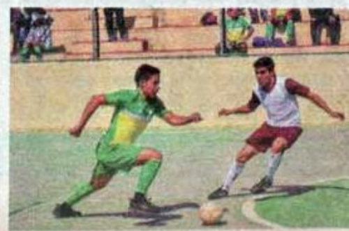
Muy intensa resultó la Final varonil.