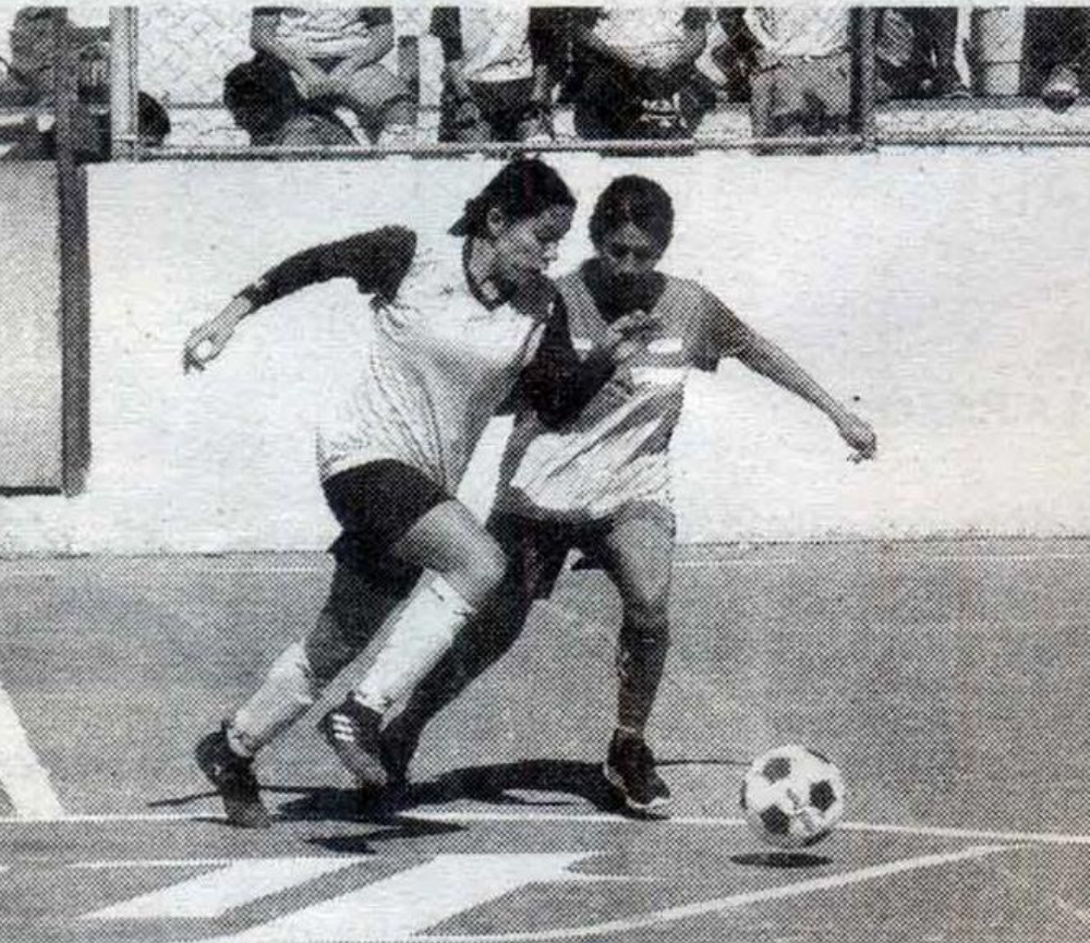
EL CONJUNTO "ROSA" dominó en gran parte del partido a Agronomía.

LA FACULTAD DE ENFERMERÍA LOGRÓ EL CAMPEONATO DEL FUTBOL BARDAS FEMENIL DE LOS INTERFACULTADES AL GANAR A AGRONOMÍA POR 4-2; TAMBIÉN LO HICIERON EN SOCCER Y BASQUETBOL