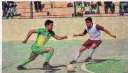
Muy intensa resultó la Final varonil.