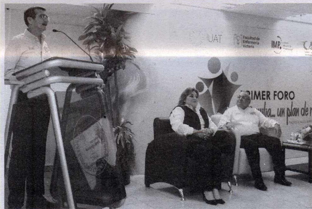
EL PROGRAMA tiene como objetivo fortalecer el principal núcleo de la sociedad.

Cabe mencionar que el Primer Foro “La Familia...un plan de rescate”, se desarrolló durante tres días con diferentes temas dirigidos tanto a los estudiantes, personal docente y profesionales de la salud, como a los padres y madres de familia, tutores, niños, niñas, adolescentes y público en general.