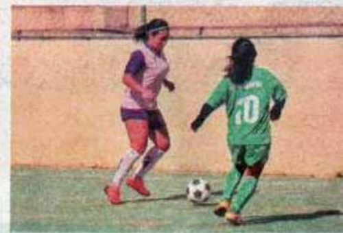
La Final Femenil estuvo llena de emociones.