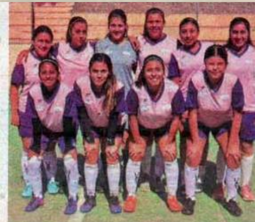
Enfermería conquistó el campeonato.