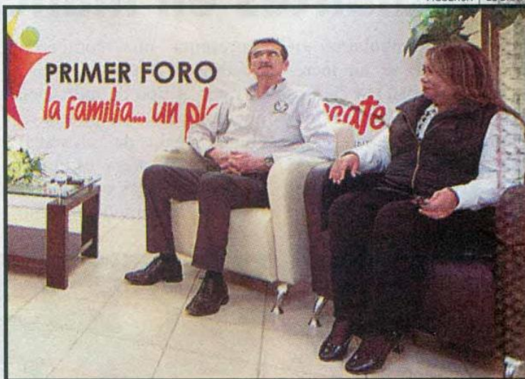
El Rector reiteró que los estudiantes son el centro del Plan de Desarrollo Institucional que rige su gestión.

Estudiantes de Enfermería El maestro Suárez Fernández invitó a los estudiantes de Enfermería a aprovechar los adelantos tecnológicos para la