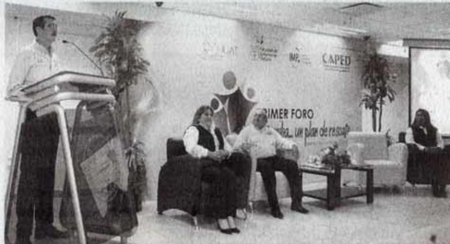
El foro es dirigido a estudiantes, docentes, padres y madres de familia.

Ante universitarios que llenaron el auditorio de la FEV, el rector reiteró que los estudiantes son el centro del Plan de Desarrollo Institucional que rige