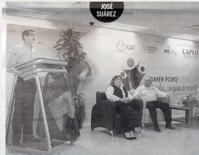
El Rector reafirmó el compromiso social de la UAT con la sociedad tamaulipeca, al poner en marcha el Primer Foro: “La Familia... un plan de rescate”.

Cabe mencionar que el Primer Foro “La Familia...un plan de rescate”, se desarrolló durante tres días con diferentes temas dirigidos tanto a los estudiantes, personal docente y profesionales de la salud, como a los padres y madres de familia, tutores, niños, niñas, adolescentes y público en general.