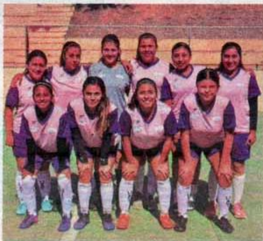
Enfermería conquistó el campeonato.