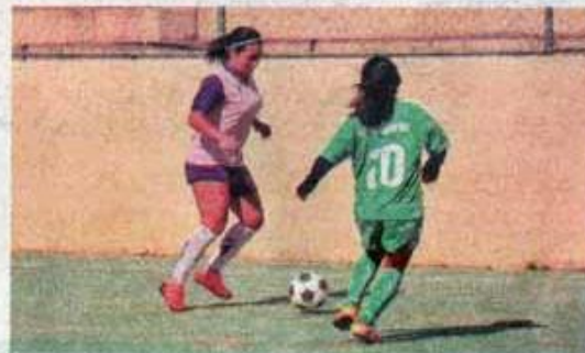
La Final Femenil estuvo llena de emociones.