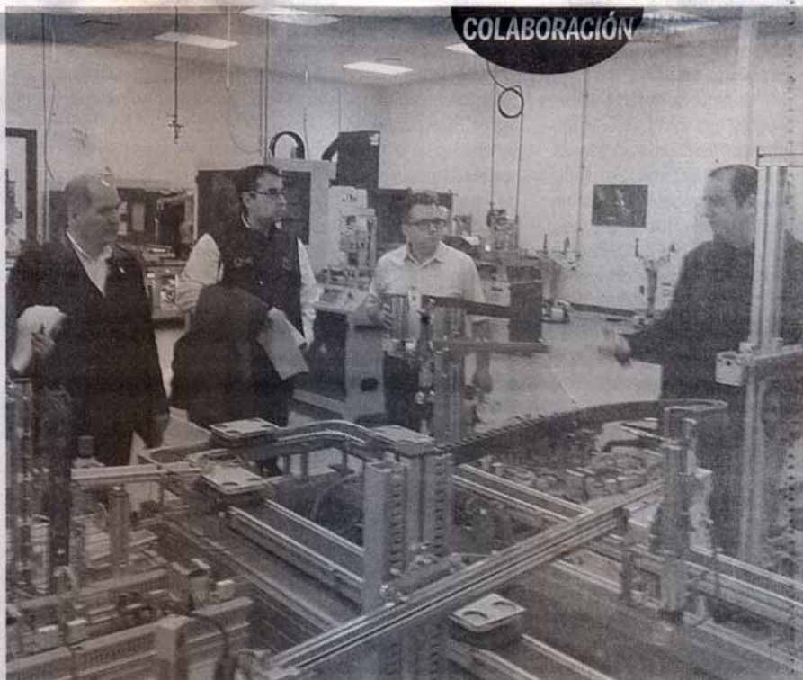
Personal docente y directivo de la UAM Rodhe realizó una reunión de trabajo con sus pares del South Texas College, en McAllen, reafirmando el objetivo de la UAT de ampliar los horizontes académicos más allá de nuestras fronteras.

En su visita, conocieron la infraestructura y equipamiento, así como los diversos programas de enseñanza y capacitación que imparten estos campus, de los cinco que comprende este colegio público comunitario en el