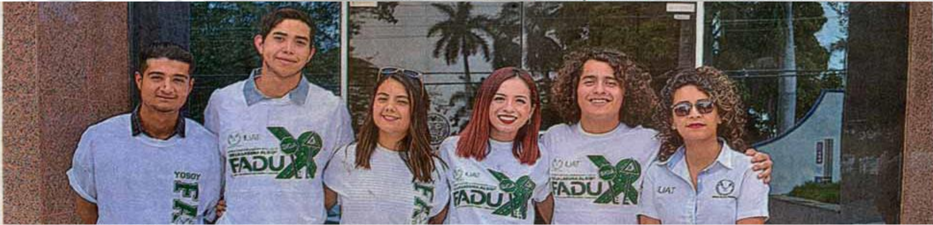
Alumnos de la FADU invitan a su "Open House", el cual se desarrollará el 27 de marzo de 2020 / CARMEN JIMÉNEZ