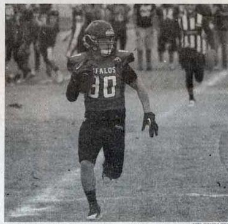
EL ATAQUE terrestre, una de las 'armas' que pondrá en funcionamiento el cuadro de los 'Búfalos'.