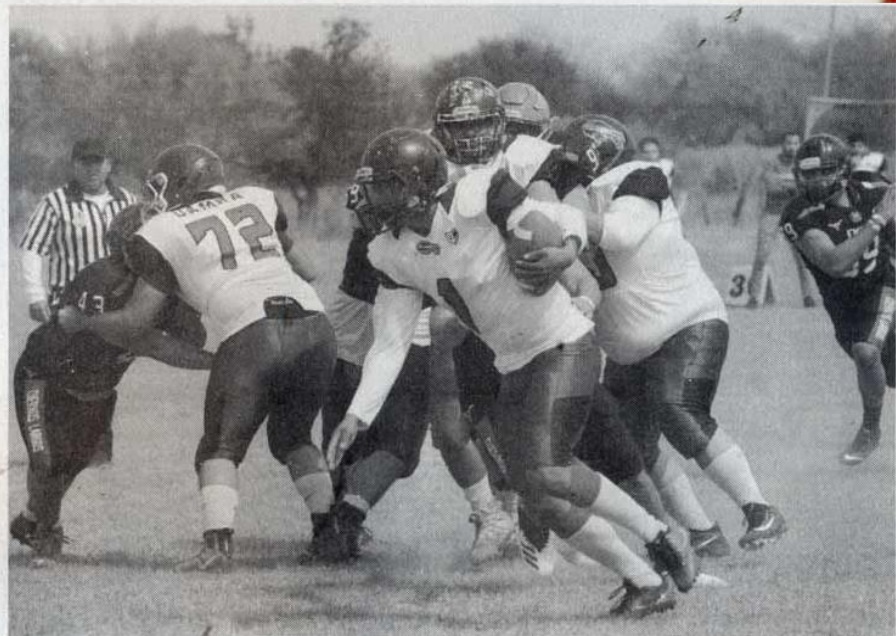
BÚFALOS Reynosa va por el tricampeonato del Fútbol Americano de la LUFAUAT ante Búhos Tampico.