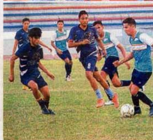
Habrará actividad en 14 disciplinas.