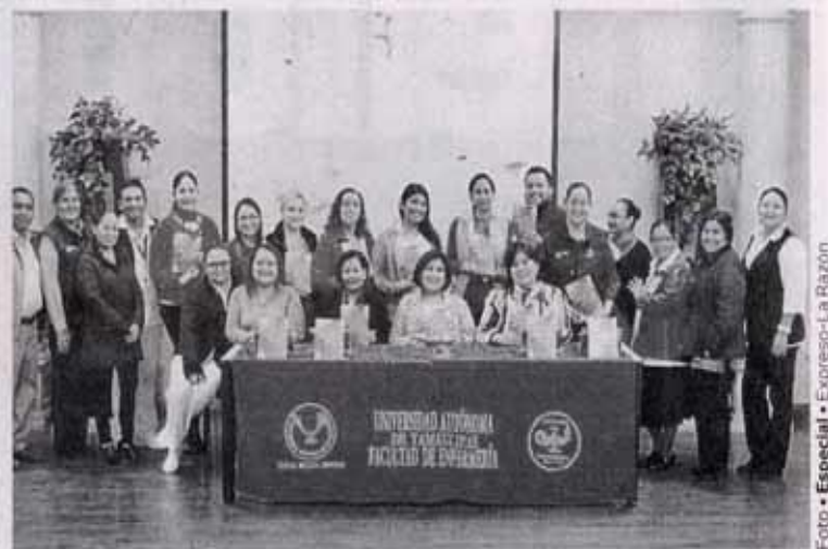
LA EXPOSICIÓN fue realizada en el Auditorio de la Facultad de Enfermería de Nuevo Laredo.

Reiteró que lo más importante es que en cada uno de los capítulos del libro está involucrada no solamente la Facultad de Enfermería de Nuevo Laredo de la UAT, están