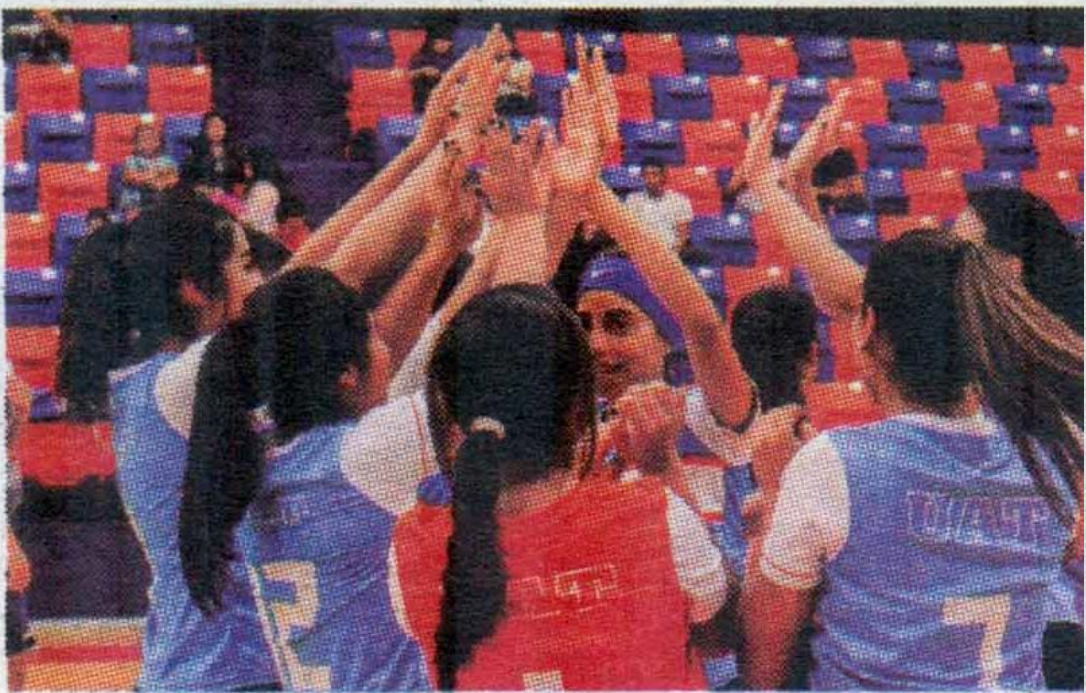
La actividad inicia a partir del día de mañana.

Salvo el Fútbol Asociación que tendrá como sede alterna Tampico, el resto de las disciplinas tendrá verificativo en escenarios del Centro Universitario Victoria y algunos externos de esta capital, como el de Softbol (Carlos Benavides) y el Béisbol (Praxedis Balboa).