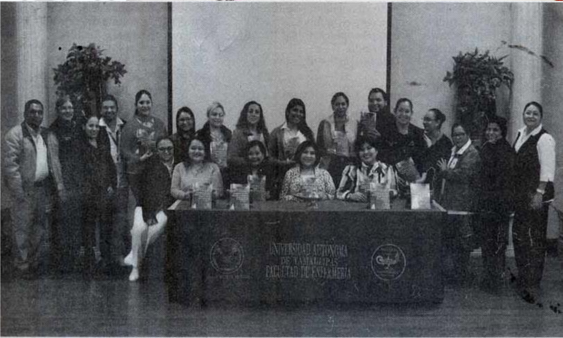
EL LIBRO , tercero que se edita, refleja el trabajo que se hace al interior de la Facultad de Enfermería.