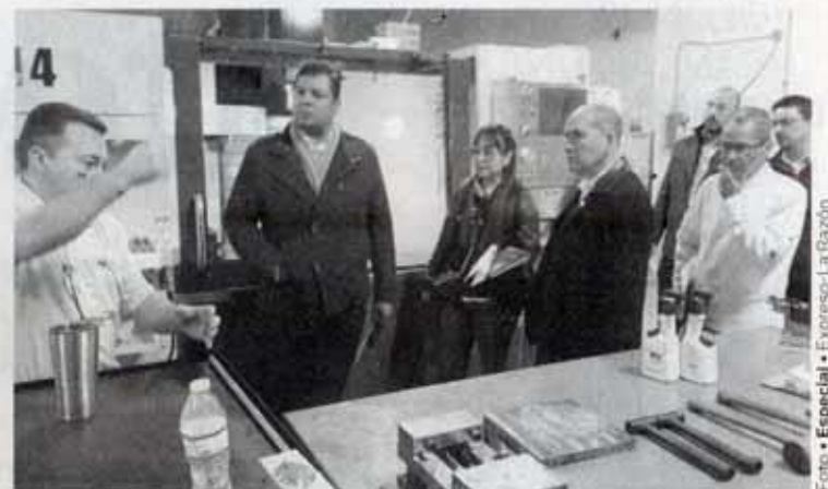
PERSONAL DE la Unidad Académica Multidisciplinaria Reynosa, realizó una visita de trabajo a las instalaciones del South Texas College

allí 8 cursos con certificación de 1 año, entre estos en Hidráulica, PVC, Robótica y Electromecánica; además de la preparación para trabajar en la industria 4.0 con interconectividad, automatización y manufactura inteligente con tecnología digital. Entre otros espacios, les mostraron también las áreas de Manufactura Avanzada y de Robotics, en el Pecan Campus, así como los espacios para estudiar Business Administration, Recursos Humanos, bibliotecas y auditorios, concluyendo con una reunión de