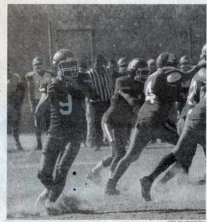
LA ESCUADRA de Búhos Tampico tratará de conquistar el título en el 'patio ajeno'.