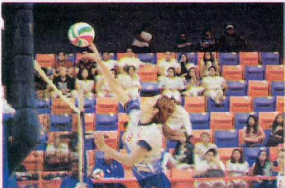
La Universidad Autónoma de Tamaulipas, tendrá actividad en las disciplinas de Baloncesto, Voleibol de Sala y Voleibol de Playa, en ambas ramas.