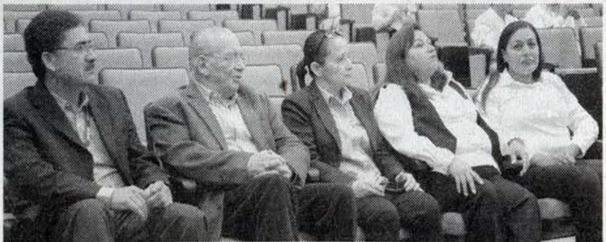
DAN A conocer en la UAT los objetivos del censo de población y vivienda 2020