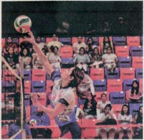
Arranca la actividad en las diversas disciplinas.