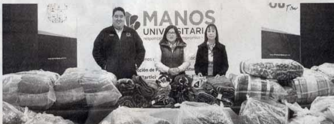
EL DONATIVO fue entregado directamente al Sistema DIF

La Universidad Autónoma de Tamaulipas (UAT) hizo entrega de 4 mil prendas de invierno y 2 mil 200 cobijas al Sistema DIF