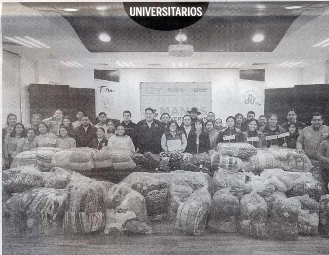
Más de dos mil cobijas y cuatro mil prendas de invierno fueron entregadas por alumnos, docentes y directivos de la UAT al DIF Tamaulipas, para coadyuvar en las tareas de proteger a las familias vulnerables ante las ondas gélidas de la temporada.