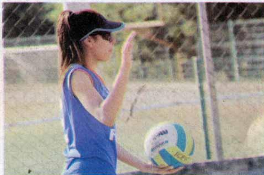
Este jueves arrancan las competencias de manera oficial en Ciudad Victoria.