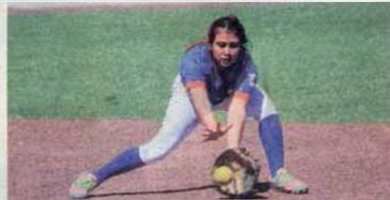
Se aplicaron a fondo.