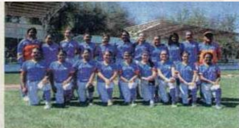
Las chicas de Softbol lograron importante resultado.

Partidos efectuados en el campo Sintético de la Villa Olímpica Tamatán.