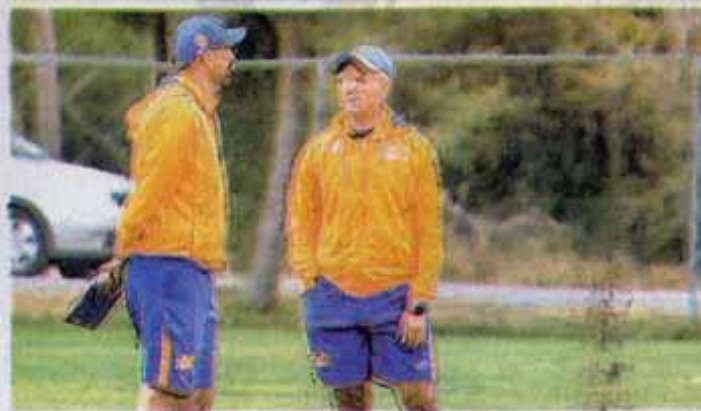
Ayer por la mañana entrenó en el Centro de Formación.

La escuadra plumífera culminó la etapa de entrenamientos en su territorio