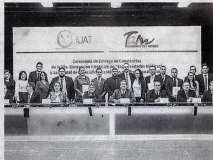
Secretaria de Salud y rector presidieron ceremonia.

Bajo este modelo, que ya es replicado en diferentes entidades del país, se formaron 12 especialistas, 8 anestesiólogos y 4 pediatras, que serán asignados a los hospitales de El Mante, Río Bravo, Altamira, San Fernando y Valle Hermoso.