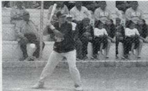
LA UAT pierde ante la novena de Ópticas Perzus