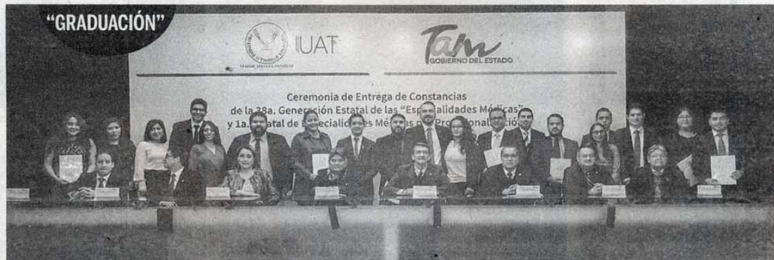
Ayer se llevó a cabo la ceremonia de entrega de constancias de la generación 38 de "Especialidades Médicas", de manera conjunta entre la Secretaría de Salud del Estado y la UAT.