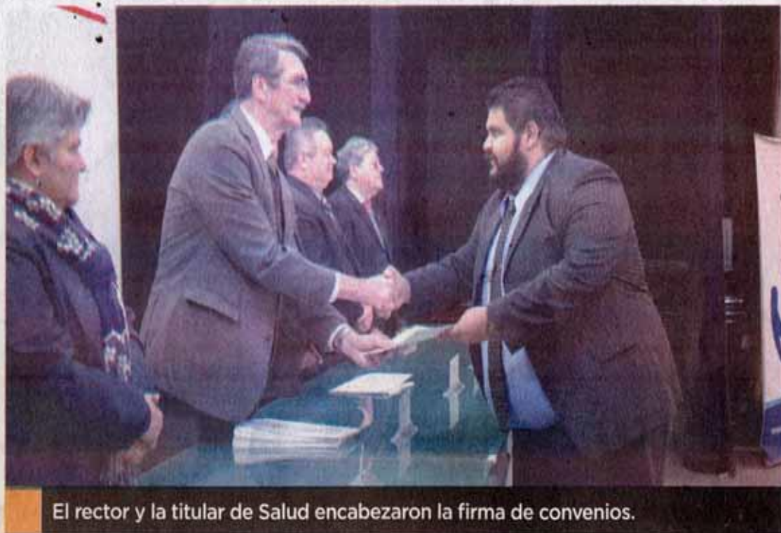
El rector y la titular de Salud encabezaron la firma de convenios.

"Y hoy que estamos cumpliendo el primer egreso, para la UAT es motivo de demostrar que cumplimos con nuestra misión de formar a los profesionistas que requiere el estado, la región y el país", agregó el Rector.