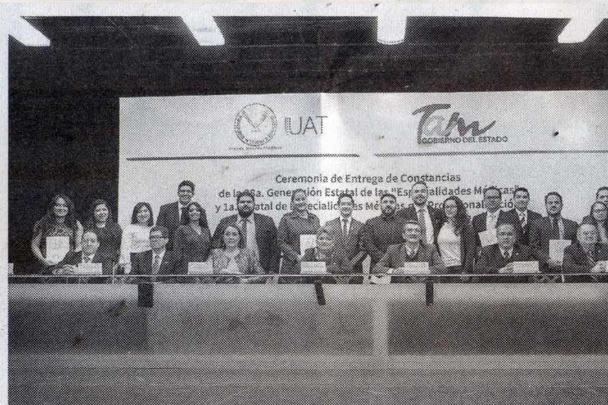
EN LA CEREMONIA se entregaron constancias a 66 profesionales de la salud.