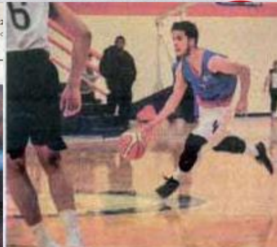
Intensa actividad se realizó durante jueves y viernes.