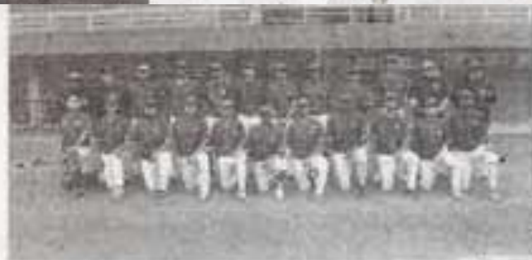
La UAT aseguró el primer lugar del Grupo Único y el pase al Regional, con dos juegos ganados y cero perdidos.

Con estos resultados, la novena de la UAT prácticamente puso un pie en el Regional.