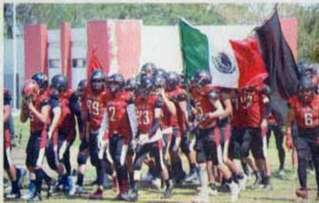
Los Búfalos de Reynosa buscarán coronarse en casa este sábado en la gran final de la categoría Intermedia.

Las batallas han sido muy reñidas y en esta edición no será la excepción. El representativo de la UAMRA, está dirigi-