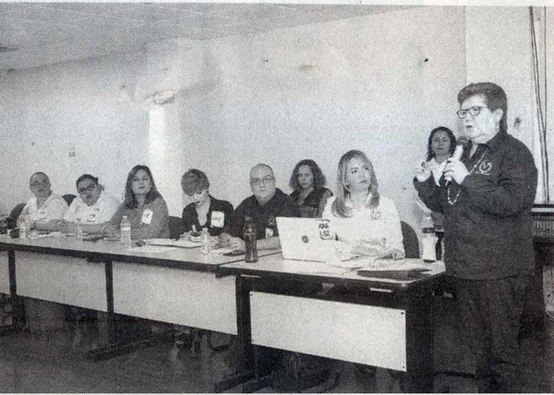
BUSCAN FORTALECER el proceso institucional de mejora académica y administrativa para los CELLAP de la UAT.

Superior (COPAES). La Dirección de Evaluación y Acreditación de la Secretaría Académica, informó que dicha labor se inscribe en el Plan de Desarrollo Institucional 2018-2021 de la UAT, dentro del Eje Estratégico relacionado con los Programas de Estudios Pertinentes y de Calidad.