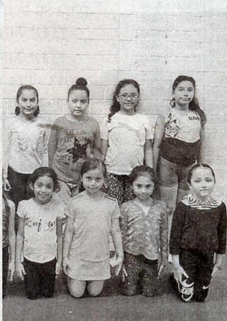
LA ESCUELA DE gimnasia rítmica de la UAT estará invitando a niñas desde los 4 años de edad a que se incorporen a sus entrenamientos

Los interesados pueden acudir a una clase de prueba, en donde además se les darán todos los informes y requisitos.