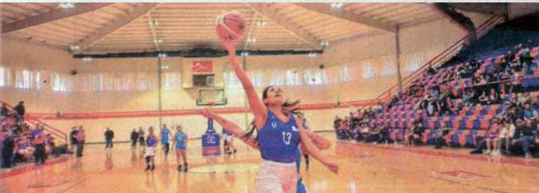
En Básquetbol femenino, la UAT impuso condiciones.