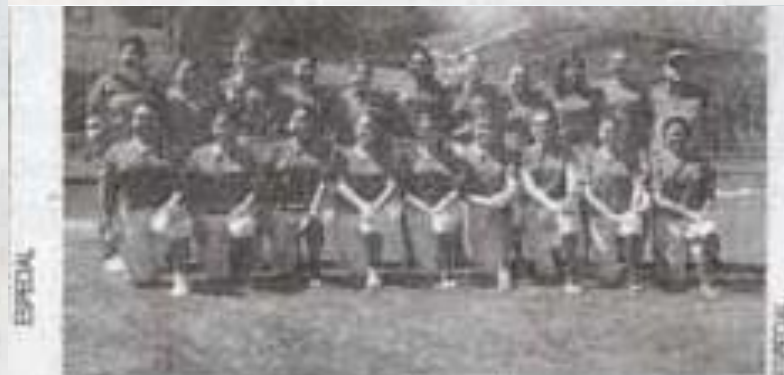
Softbol Femenil venció 15-0 al Tec Victoria y pone un pie en el regional.

Softbol, beisbol y futbol asociación representarán a la máxima casa de estudios rumbo a los Juegos del CONDDE