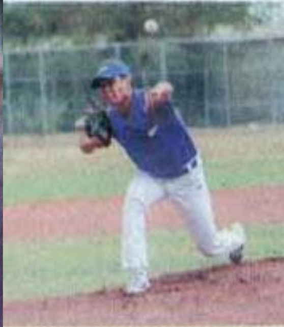
En Béisbol también salieron avantes.