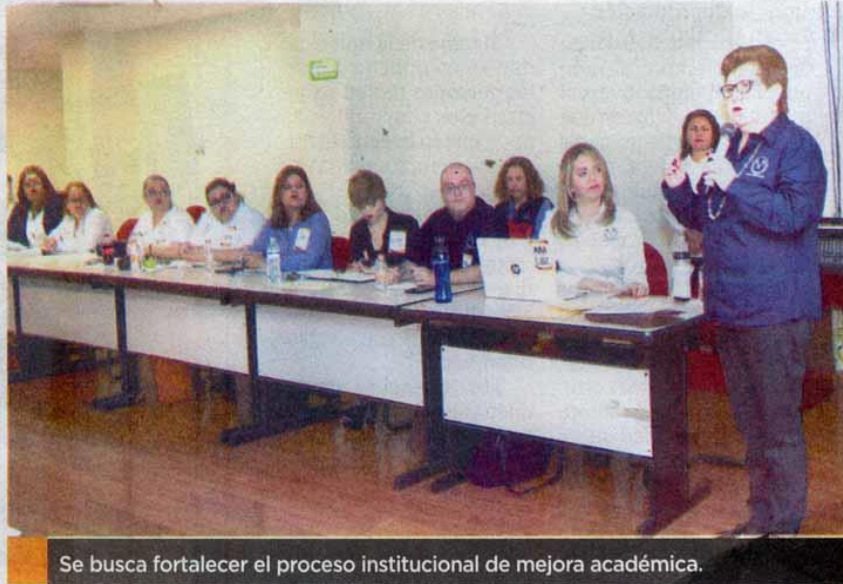
Se busca fortalecer el proceso institucional de mejora académica.

La Dirección de Evaluación y Acreditación de la Secretaría Académica, informó que dicha labor se inscribe en el Plan de Desarrollo Institucional 2018-2021 de la UAT, dentro del Eje Estratégico relacionado con los Programas de Estudios Perinentes y de Calidad. El taller "Alineación de