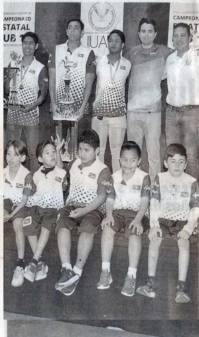
UAT-TAMPICO es de los equipos favoritos para ganar el título /

Por último, los invitados de honor realizaron el saque inicial, con lo que se puso a rodar el balón de manera oficial del campeonato que continuará el día de hoy y llegará a su término mañana domingo.