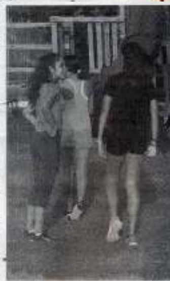
VIENE PREPARÁNDOSE junto con sus compañeros para regresar más fuerte apenas concluya la pandemia del Covid-19.