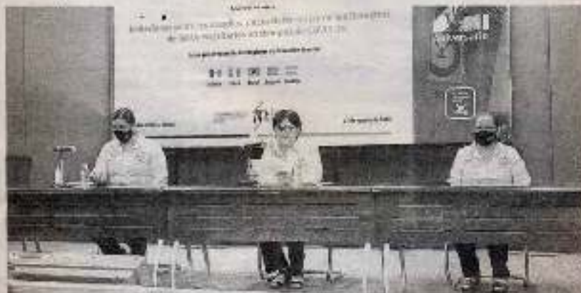
LA CEREMONIA DE INAUGURACIÓN fue realizada desde el Centro de Excelencia del Campus Victoria.