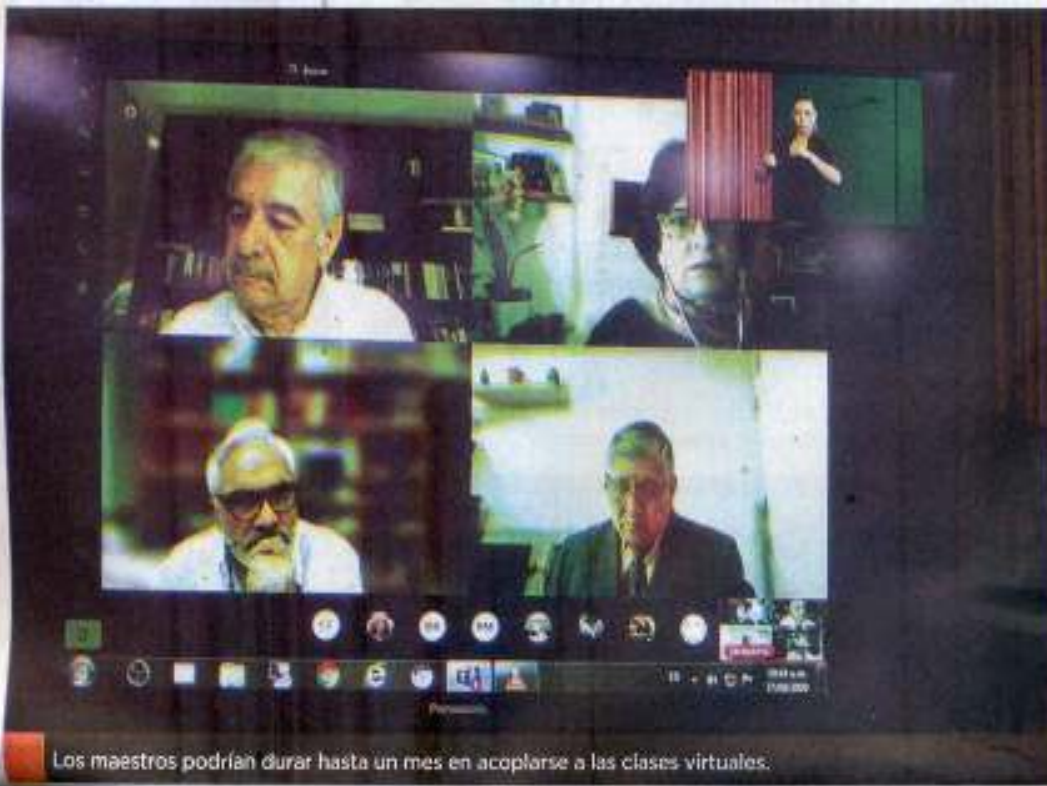
Los maestros podrían durar hasta un mes en acoplarse a las clases virtuales.