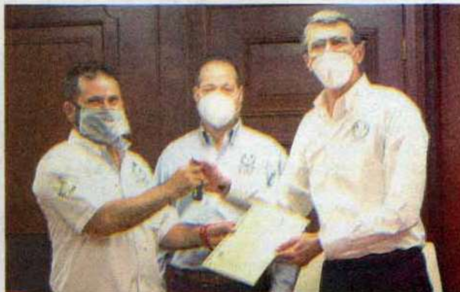
El rector felicitó a los docentes agraciados con el premio y reiteró el respaldo permanente.

EN CEREMONIA efectuada en las oficinas centrales se llevó a cabo acto simbólico de reparto de los automóviles a los docentes de las zonas norte, centro y sur