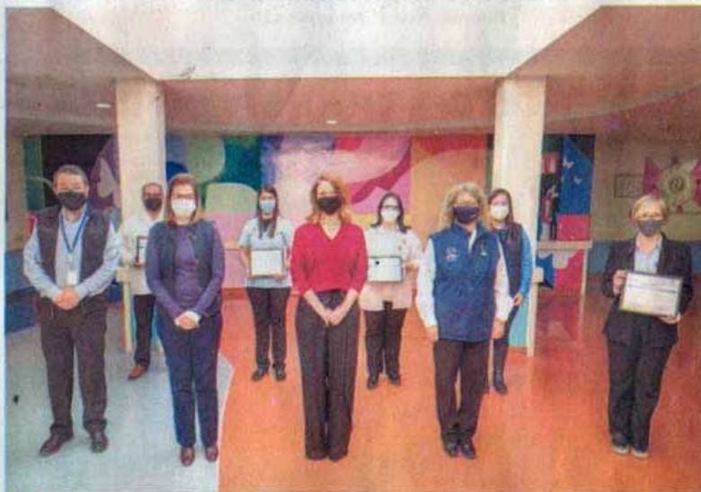
El DIF Tamaulipas y la UAT realizaron un diplomado sobre Trastornos del Espectro Autista.