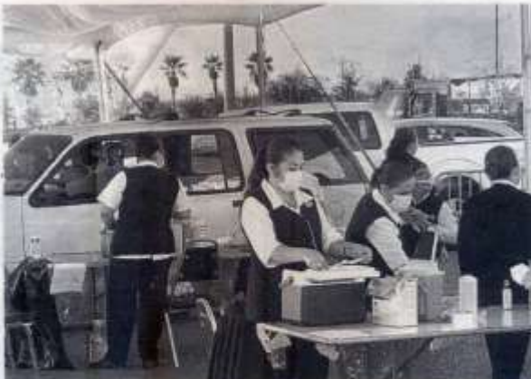
AYER SE APRECIARON menos filas en los centros de vacunación.