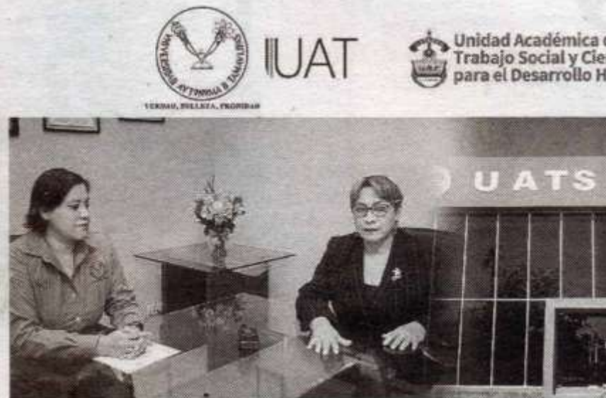
ORGANIZA TRABAJO social jornada para difundir igualdad de género.

Microsoft TEAMS, se enlazará a la expositora con nuestros alumnos, para poder interactuar en una transmisión en vivo y así lograr disipar dudas o inquietudes de los asistentes en estos temas; posteriormente abordaremos el tema de igualdad de género durante este mes".