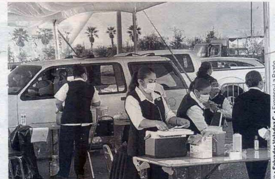
• Salvador Valadez C. • Expreso-La Razón