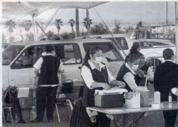
AYER SE APRECIARON menos filas en los centros de vacunación.