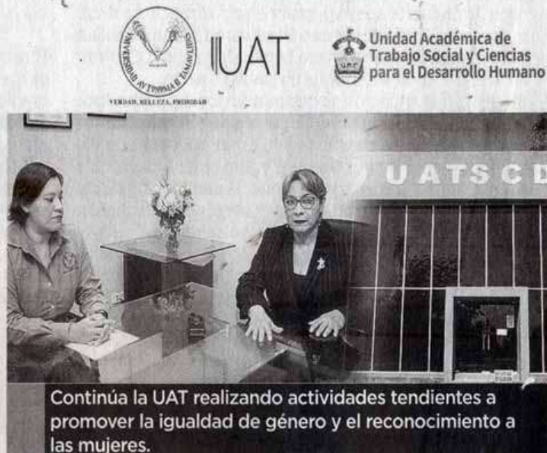
Continúa la UAT realizando actividades tendientes a promover la igualdad de género y el reconocimiento a las mujeres.

"A través de plataforma de Microsoft TEAMS, se enlazará a la expositora con nuestros alumnos, para poder interactuar en una transmisión en vivo y así lograr disipar dudas o inquietudes de los asistentes en es-