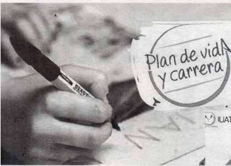
IMPARTEN A alumnos de la Uat curso en línea Plan de Vida y Carrera