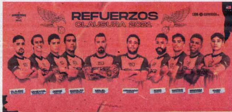
Estos son los refuerzos para el torneo clausura 2021.