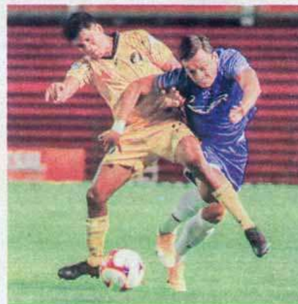
Correcaminos disputó tres encuentros en la pretemporada.

Ahora también se pusieron de novedosos y se fueron al Mirador de Alta Cumbres, para tomar la foto oficial que simplemente quedó espectacular, en uno de los sitios más visitados por los tamaulipecos durante los últimos meses.