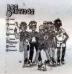
CON DIBUJOS, se divulga la vocación científica.