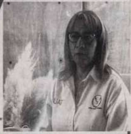
Dan a conocer las publicaciones recientes y colaboraciones que realizan los investigadores de la UAT.