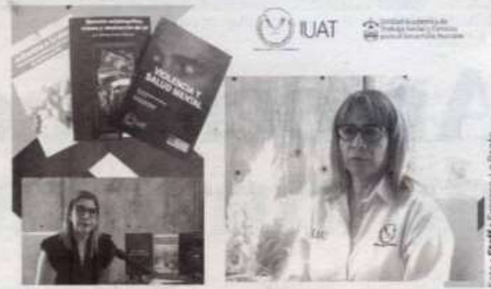
DIFUNDEN las aportaciones académicas de los investigadores de la UAT.

DESTACAN LIBROS Y PUBLICACIONES DE AUTORES DE LA UNIDAD ACADÉMICA DE TRABAJO SOCIAL Y CIENCIAS PARA EL DESARROLLO HUMANO DEL CAMPUS VICTORIA