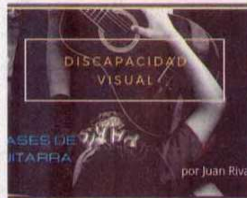
por Juan Riva

Para conocer más acerca del trabajo del profesor universitario, pueden acceder también a los sitios www.facebook.com/juanrivasguitarista ; @juanrivasguitarista (Instagram Twitter); www.youtube.com/juanrivas además del teléfono 8332451371.