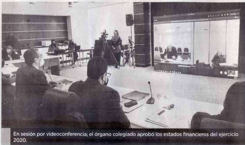
En sesión por videoconferencia; el órgano colegiado aprobó los estados financieros del ejercicio 2020.

ES SOBRE el ejercicio 2020 y la propuesta presupuestal para el 2021 de la Universidad Autónoma de Tamaulipas