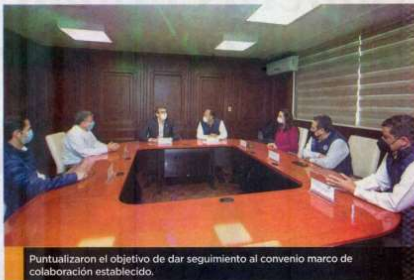
Puntualizaron el objetivo de dar seguimiento al convenio marco de colaboración establecido.

En reunión celebrada en las oficinas de la Rectoría en esta capital, se puntualizó el objetivo de dar seguimiento al convenio marco de colaboración establecido con anterioridad, y a partir de la cual se han generado una serie de proyectos entre los que destacan, los proyectos de aprovechamiento de especies acuícolas como moluscos y crustáceos para el desarrollo de materiales dentales, de la Facultad de Odontología de Tampico; en materia de acuicultura con la Facultad