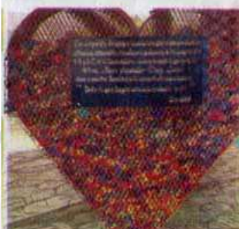
Realiza UAT campaña para recaudar taparroschas en apoyo a la población con cáncer.

rez Juárez, afirmó en entrevista que aun con la pandemia se lograron reunir recursos para 386 pacientes. Agradeció a la UAT por el apoyo que les han brindado desde el 2016, año en que arrancó esta iniciativa de apoyar a pacientes de escasos recursos que han sido diagnosticados con algún tipo de cáncer. "Con ayuda de la universidad hemos reunido hasta cuatro toneladas de taparroschas en menos de cuatro meses, visitando instituciones educativas e invitando a los