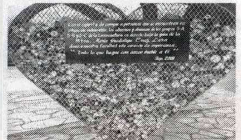
PIDEN al público a participar en la recolección de taparroschas.