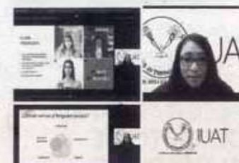
EN LA UAT, impulsan el lenguaje incluyente.