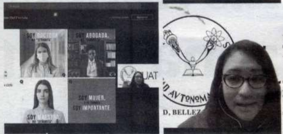
LA UAT realizó la conferencia virtual denominada "Lenguaje incluyente, no sexista"

de tipo simbólica mediante el uso de patrones estereotipados, mensajes, valores, íconos o signos que transmitan y reproduzcan dominación, desigualdad y discriminación, tomando como fundamento la Ley General de Acceso a las Mujeres a una Vida Libre de Violencia y la Ley para Prevenir, Atender, Sancionar y Erradicar la Violencia contra las Mujeres. Se enfatizó en temas como violencia mediática, lenguaje incluyente, lenguaje sexista, androcentrismo, roles o estereotipos, por mencionar algunos. Cabe mencionar que estas acciones forman parte del programa Igualdad-es-UAT, que busca transversalizar una cultura de la igualdad en la comunidad universitaria, mediante la promoción y sensibilización de una cultura de la igualdad de género, y la prevención y atención de la violencia de género en nuestra máxima casa de estudios.