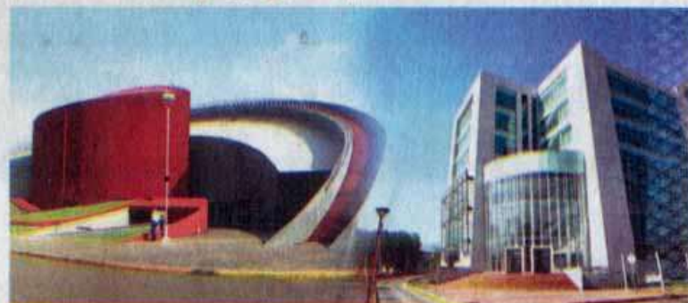
La UAT abrió las inscripciones para los aspirantes a nuevo ingreso.