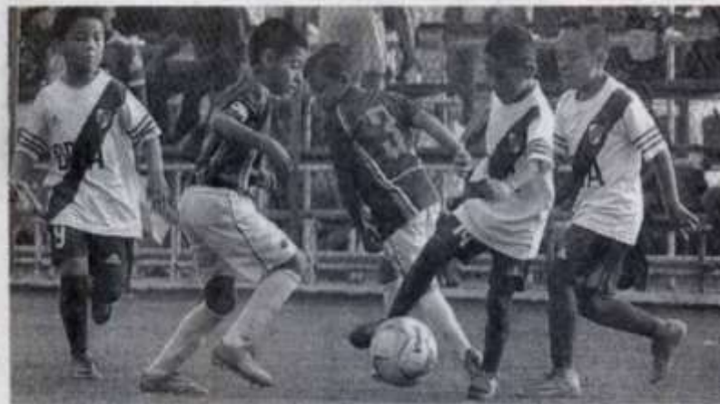
EL TORNEO de Verano en la Copa UAT de fútbol Infantil.

CEFFUT 2-2: EF Pitufos ante Aca. Batata Rocha a las 16:10 horas y Rayados Victoria ante Leones FC a las 17:20 horas ambos en Bip Bips.