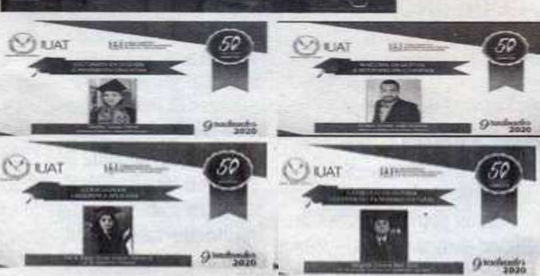
DE FORMA virtual se realiza la graduación en Ciencias de la Educación.