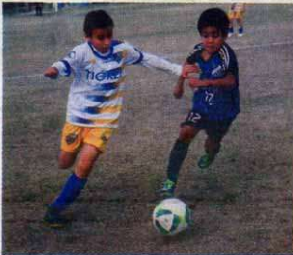
Regresa la actividad del futbol infantil.

“Es un momento que esperamos por mucho tiempo y que estoy seguro todos echamos de menos, por eso ahora que nos dieron la oportu-