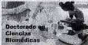
Doctorado en Ciencias Biomédicas