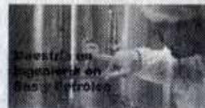
Maestría en Ingeniería de Gas y Petróleo