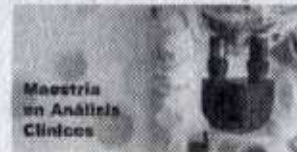
Maestría en Análisis Clínicos