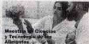
Maestría en Ciencias y Tecnología de los Alimentos

Unidad Académica Multidisciplinaria Reynosa-AZTLÁN