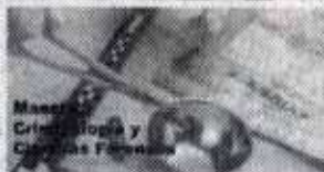
Maestría en Criminología y Ciencias Forenses