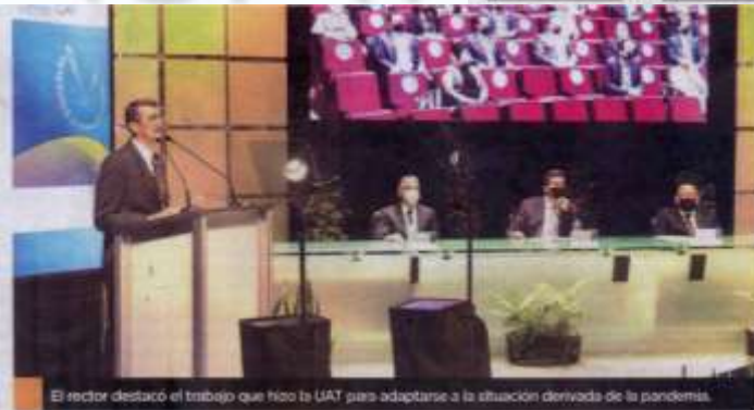
El rector destacó el trabajo que hizo la UAT para adaptarse a la situación derivada de la pandemia.