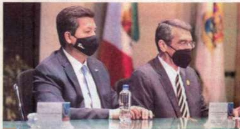
El gobernador Francisco García Cabeza de Vaca reiteró el respaldo a la Máxima Casa de Estudios del Estado.

"En la Universidad Autónoma de Tamaulipas, se siembra la semilla del co-