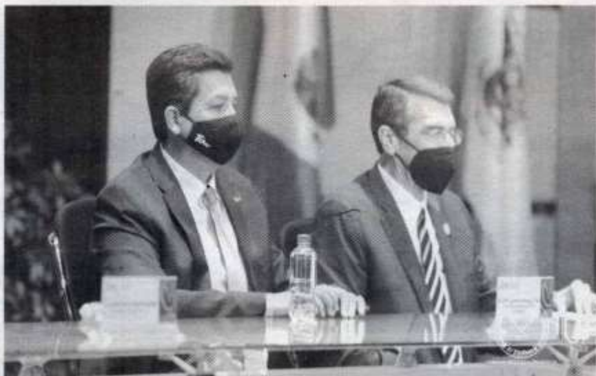
EL GOBERNADOR reconoció el esfuerzo realizado por la Universidad Autónoma de Tamaulipas