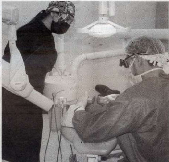
REANUDAN SERVICIOS de la Clínica Dental disponibles para la sociedad en general.

Las clínicas son un servicio de la Universidad donde sus estudiantes de licenciatura y posgrado hacen su práctica con toda la atención básica y hasta rehabilitaciones completas, en las que se atiende a pacientes de Tamaulipas y entidades vecinas.