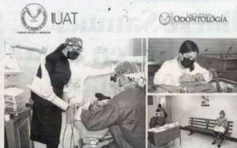
VUELVE a dar tercio, clínica dental de la UAT en Tampico.

Debido a la contingencia por COVID-19, y aunado a los protocolos de filtros sanitarios, módulo de sanitización, tapete desinfectante de calzado, dispensador de gel antibacterial, uso de cubrebocas y termómetro infrarrojo, solo se atenderá a pacientes que acudan a la clínica con previa cita al