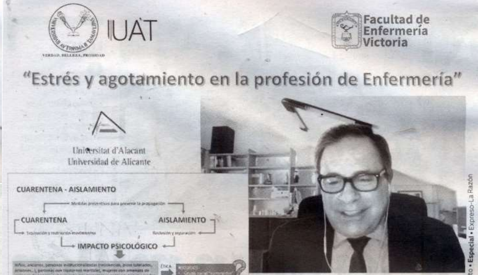
EVALIÁN EL papel de la enfermería en la atención a la pandemia de COVID

"Basada en pseudoexpertos que hablan de todo, que parecen tener conocimiento absolutamente de todo y lo único que hacen es trasladar alarma, incertidumbre, miedo y, por lo tanto, resistencia ante determinadas informaciones provenientes del ámbito científico y técnico", concluyó.