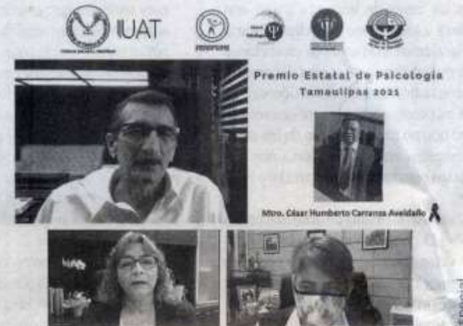
La máxima casa de estudios reconoció la importante labor de los psicólogos en la sociedad.