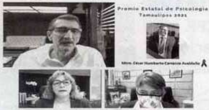
Premio Estatal de Psicología Tamaulipas 2021