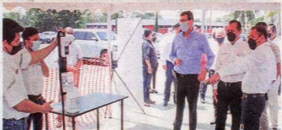
PREPARA la UAT, regreso a clases presenciales.

La Universidad Autónoma de Tamaulipas (UAT) prepara el regreso gradual a sus actividades presenciales en todas sus facultades, unidades académicas y escuelas, en cuanto las condiciones sanitarias para la prevención de contagios por COVID-19 así lo permitan.