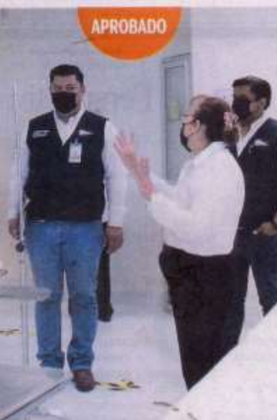
Personal de la Coepris visitó la Facultad de Enfermería de la UAT para verificar los protocolos de seguridad para el regreso seguro a clases presenciales.

La Facultad de Enfermería Victoria (FEV) de la Universidad Autónoma de Tamaulipas (UAT) recibió el distintivo Escuela Segura, otorgado por el Comité Estatal de Seguridad en Salud a través de la Comisión Estatal para la Protección contra Riesgos Sanitarios (Coepris).