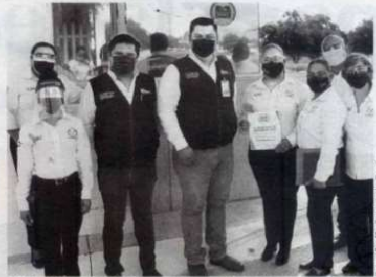
CERTIFICAN SEGURA a la Facultad de Enfermería para el regreso a clases.

El distintivo Escuela Segura se otorga por la atención y el cumplimiento permanente de los protocolos y de las medidas de protección sanitaria para evitar la propagación y contagio de la enfermedad de COVID-19.