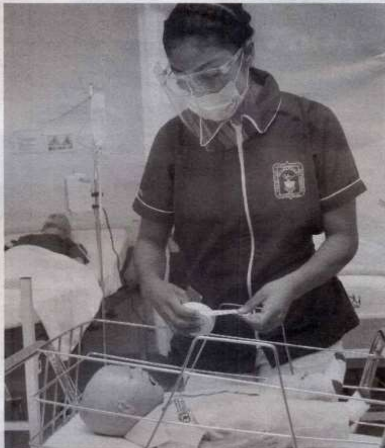
ABRE LA UAT práctica en laboratorios en instalaciones universitarias

En el caso de la modalidad presencial, los estudiantes regresaron a las instalaciones de la UAT en diferentes sedes académicas que ofertaron materias con un alto porcentaje de actividades prácticas en laboratorio o campo, y que, por la emergencia sanitaria, no pudieron realizarse en los periodos 2020-1, 2020-3 y 2021-1 del calendario escolar universitario.