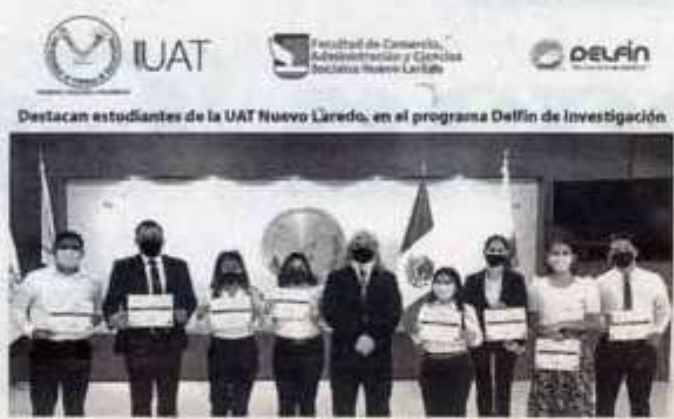
DESTACAN ESTUDIANTES en programa de investigación.

FORTALECE FACULTAD DE COMERCIO EL DESARROLLO DE LA INVESTIGACIÓN A TRAVÉS DEL PROGRAMA INTERINSTITUCIONAL DE INVESTIGACIÓN Y POSGRADO DEL PACÍFICO (PROGRAMA DELFÍN) STAFF