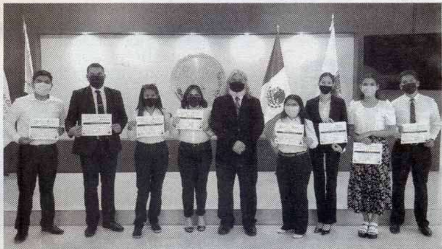
ENTREGA LA UAT reconocimientos a estudiantes que participaron de manera virtual en el programa Delfín