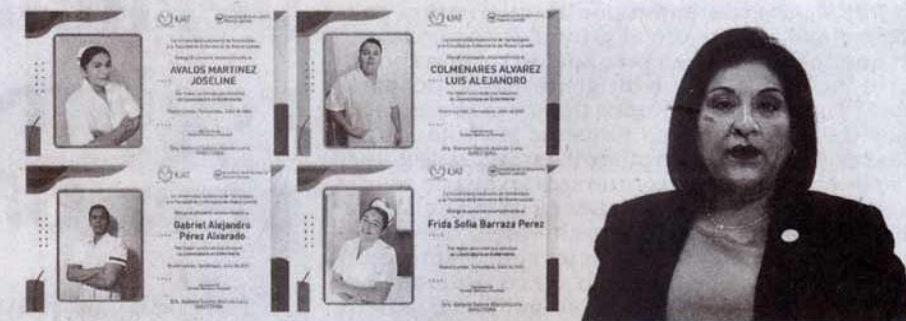
Más de 100 alumnos de Enfermería concluyeron sus estudios.

exige de ellos el compromiso de ejercer la profesión con responsabilidad y mantenerse en constante preparación ante las frecuentes innovaciones que surgen en el área de la salud.