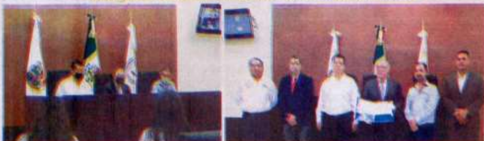
La UAT cuenta con un Centro de Mediación Público como método de justicia alternativa.