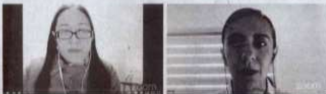
Realizó la UAT el Programa en Habilidades y Competencias para el Desarrollo Profesional, dirigido a sus estudiantes.