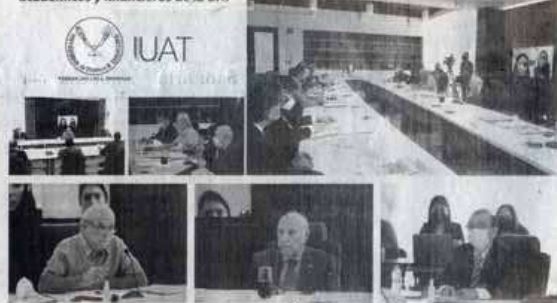
Destaca patronato los logros académicos y financieros de la UAT

En la consolidación de ese proyecto se puso a disposición del público la app de información académica y medios de comunicación "Tu Canal Universitario" para dispositivos móviles y de escritorio, que proporciona, entre otros servicios, toda la oferta educativa, el acceso a la transmisión en vivo del canal y a los distintos medios informativos de