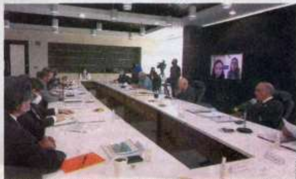
El Patronato Universitario reconoció todos los logros académicos y financieros de la máxima casa de estudios.

Patronato Universitario reconoce que la UAT sostiene un manejo ordenado y transparente de sus recursos, además de garantizar una educación de calidad