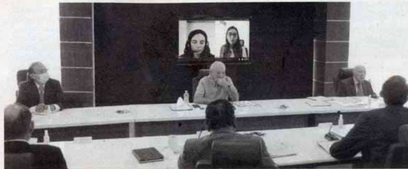
EL PATRONATO está integrado por representantes ciudadanos.

Igualmente el de Fitch Ratings, que otorgó a la UAT la calificación AA (mex) con perspectiva estable, una de las más altas asignaciones