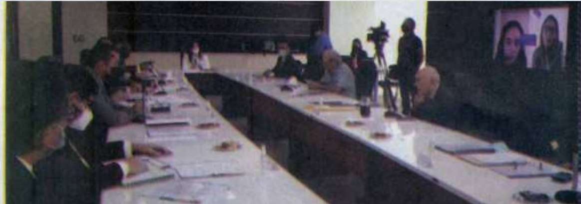
EL PATRONATO Universitario reconoció el impecable trabajo de la UAT.