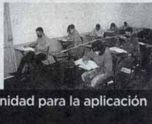
Cumplen protocolos de sanidad para la aplicación del examen.

ceso de nuevo ingreso al próximo ciclo escolar.