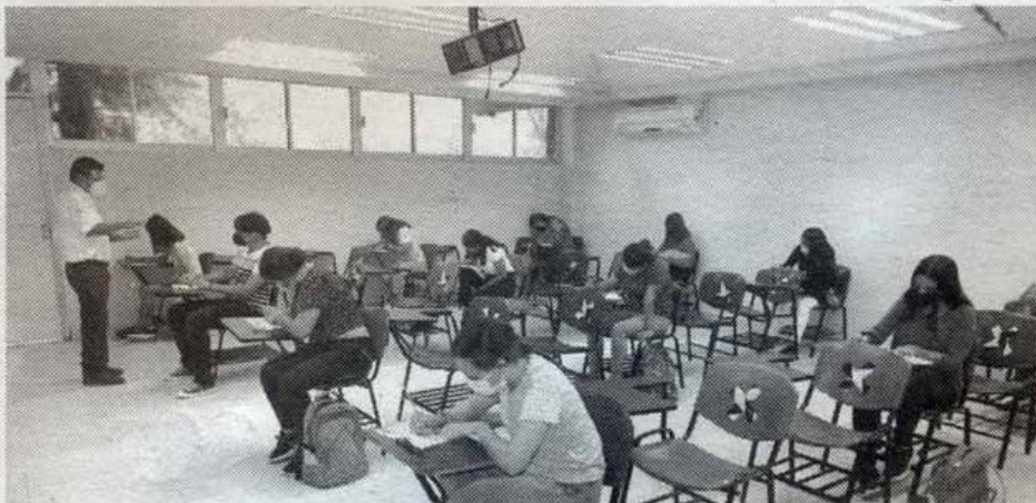
PRESENTAN ASPIRANTES examen CENEVAL

En apego al proceso de admisión para el período escolar 2021-3 (otoño) de la Universidad Autónoma de Tamaulipas (UAT), los aspirantes a ingresar a los programas educativos de esta casa de estudios respondieron el Examen General de Ingreso a Licenciatura (EXANI II) del Centro Nacional para la Evaluación de la Educación Superior (CENEVAL). Con más de ochenta carreras en todas las disciplinas del conocimiento, distribuidas en sus diferentes facultades y unidades académicas de las zonas norte, centro y sur del estado, la Universidad desarrolló el proceso de nuevo ingreso al próximo ciclo escolar. De acuerdo con el calendario administrativo y escolar de la Universidad, el EXANI II del CENEVAL se programó en dos modalidades: desde casa en forma virtual, que se llevó a cabo el 7 de julio, y presencial, los días 13 y 14 del mismo mes con distintos horarios y aforo de alumnos en las aulas designadas por los planteles. Con base en la demanda de so-