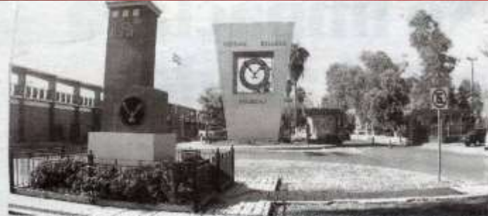
LOS ESTUDIANTES podrán acceder a un 50% de descuento en el pago

Entre los requisitos, el aspirante a la beca debe demostrar la situación de vulnerabilidad económica en la que vive, ya que el apoyo tiene el propósito de ayudar a las familias en esta época de pandemia. Para mayores informes, comunicarse a través de la página de Facebook de la Dirección de Becas UAT.