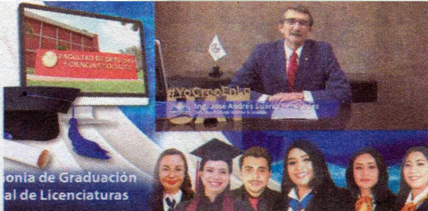
ceremonia de Graduación virtual de Licenciaturas