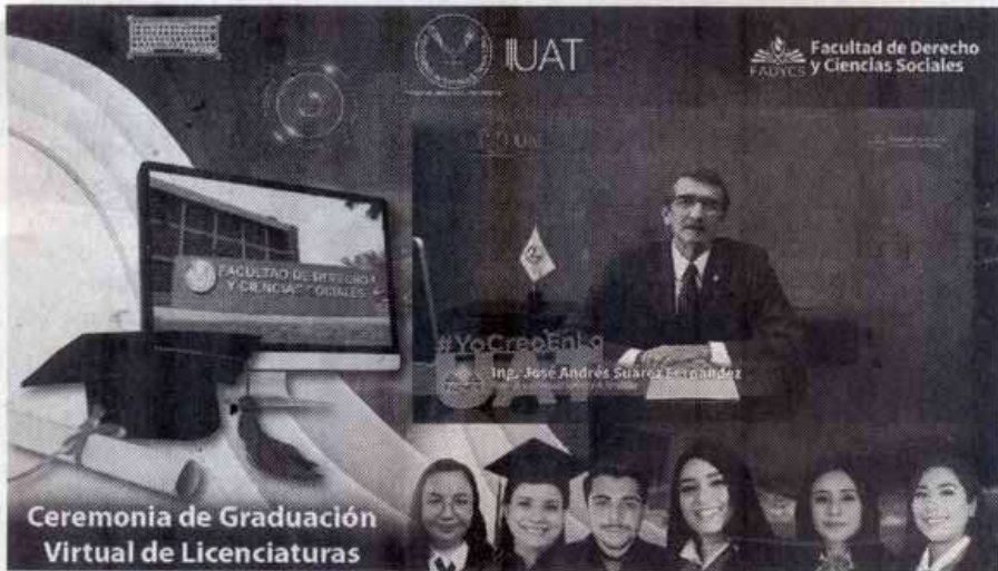
Ceremonia de Graduación Virtual de Licenciaturas