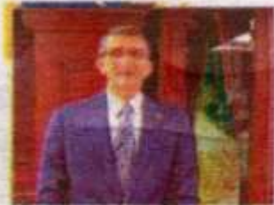
La entrega de reconocimientos Generales "Don Ramón Elizabeth Alvarez Roda"