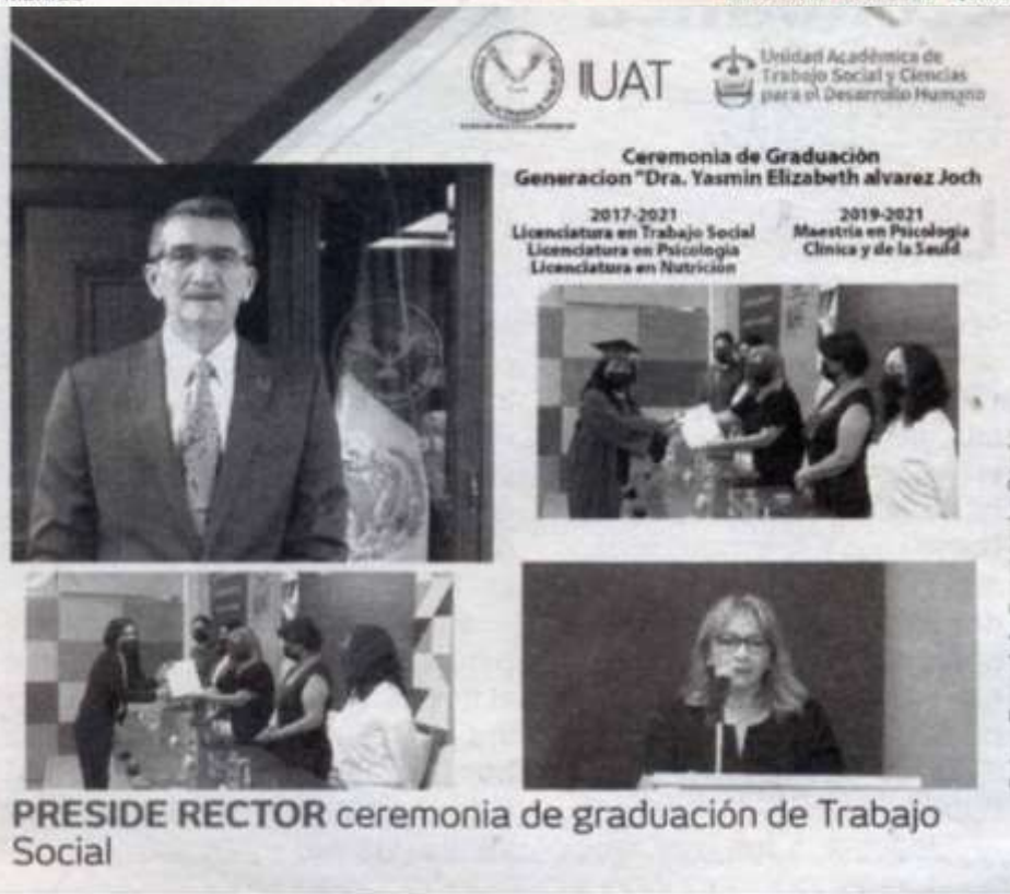
PRESIDE RECTOR ceremonia de graduación de Trabajo Social