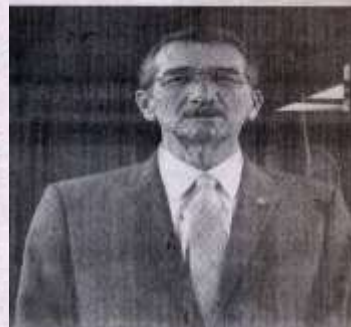
Unidad Académica Multidisciplinaria de Ciencias, Educación y Humanidades