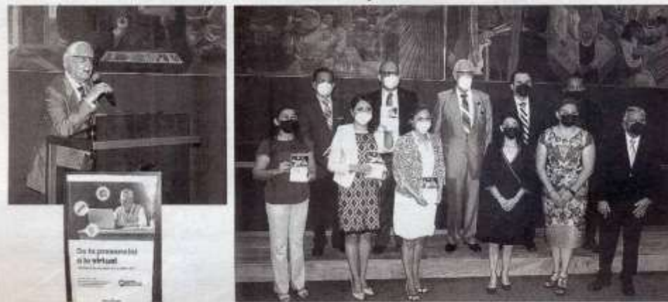
MAESTROS EXPONEN sus experiencias de lo presencial, a lo virtual