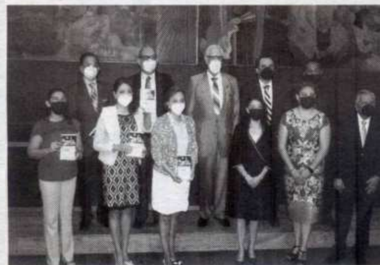
INVESTIGADORES Y docentes presentan libro 'De lo presencial a lo virtual'