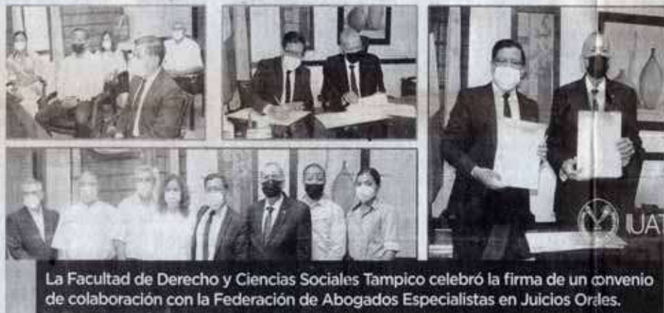
La Facultad de Derecho y Ciencias Sociales Tampico celebró la firma de un convenio de colaboración con la Federación de Abogados Especialistas en Juicios Orales.

FADYCS y la Federación de Abogados Especialistas en Juicios Orales, A.C. firman convenio de colaboración académica