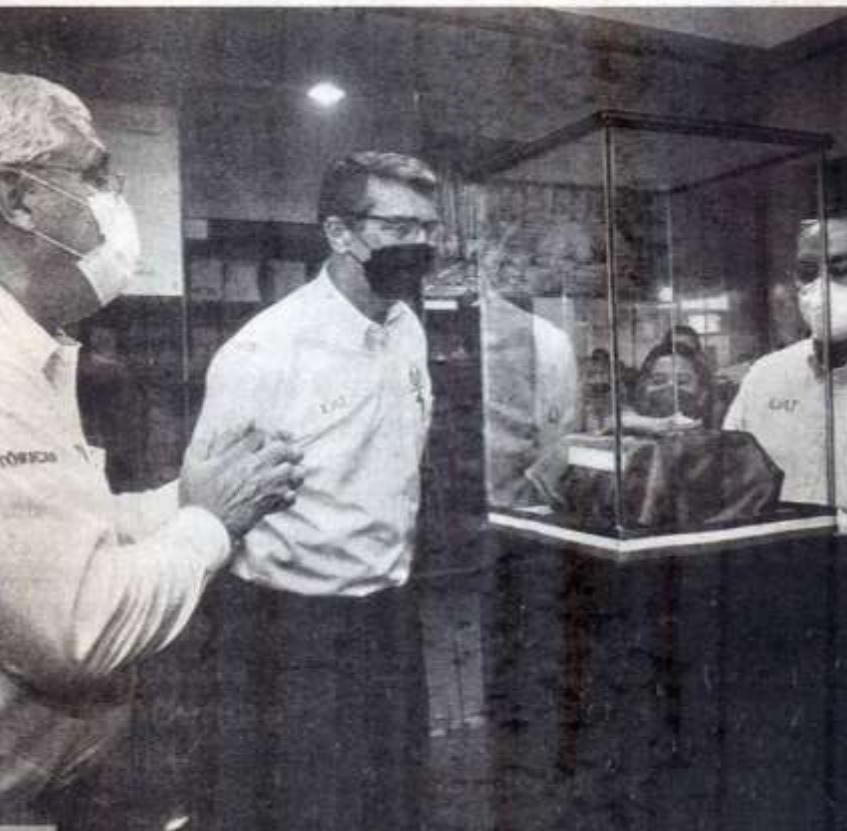
La exposición se encuentra abierta al público en el segundo piso del Edificio Centro de Gestión del Conocimiento en el Centro Universitario Victoria.

Su título es '200 años de Independencia de México'