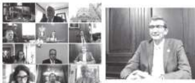
Colabora UAT en Tribunal Universitario de la UNAM

virtual por la plataforma Zoom, se destacó el propósito de que más universidades de México se sumen a las acciones para atender problemáticas que se presentan en el contexto escolar universitario.