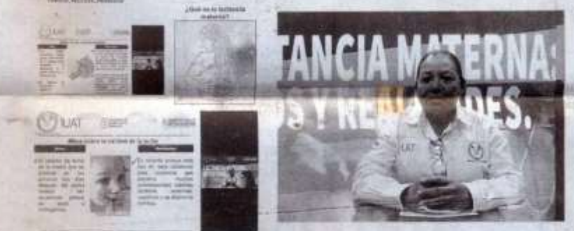
En conferencia virtual, especialistas de Enfermería de la UAT hablan sobre mit realidades de la lactancia materna.

Cabe señalar, que activamente se realizó con el Programa de Promoción de Lactancia Materna de la Facultad de Enfermería Victoria en este marco, se realizaron foros, capacitaciones y espacios de promoción de esta práctica, dirigidos a docentes, estudiantes y ptes de la Licenciatura en Enfermería, así como a profesionales de la salud y al público en ral-