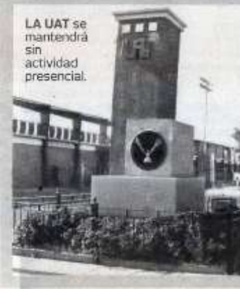
LA UAT se mantendrá sin actividad presencial.

plementar un poco la ausencia de presencialidad con cosas virtuales que en unas condiciones normales no podrían alcanzar". "Estamos en proceso de admisión del próximo semestre y tenemos saturado todos grupos, tanto en derecho, que siempre existe un exceso de demanda, en el caso de Turismo aumentó la demanda por lo que ha ganado la facultad diversos premios.