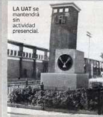
LA UAT se mantendrá sin actividad presencial.

"Estamos en proceso de admisión del próximo semestre y tenemos saturado todos grupos, tanto en derecho, que siempre existe un exceso de demanda, en el caso de Turismo aumentó la demanda por lo que ha ganado la facultad diversos premios.