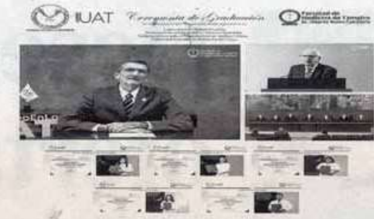
ENCABEZA el rector, graduación de facultad de medicina de la UAT Tampico.

DE LA CARRERA DE MÉDICO CIRUJANO Y PROFESIONAL ASOCIADO EN LAS ÁREAS DE ADMINISTRACIÓN BIOMÉDICA, LABORATORISTA DE ANÁLISIS CLÍNICOS Y REHABILITACIÓN FÍSICA