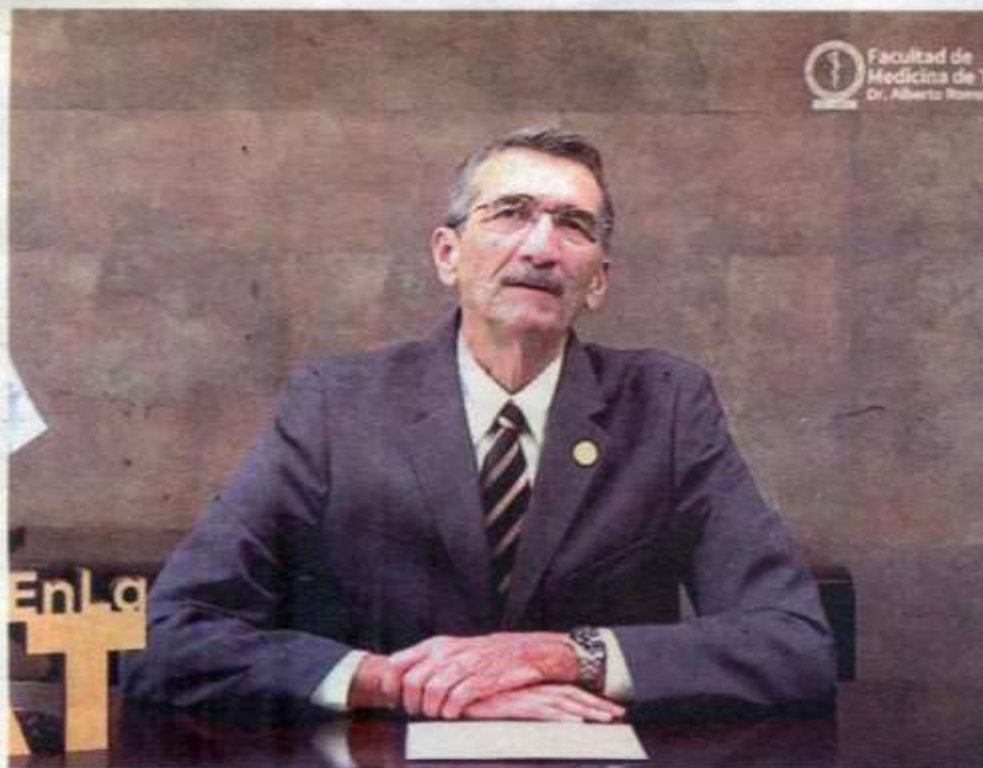
Facultad de Medicina de Tampico Dr. Alberto Romo Caballero