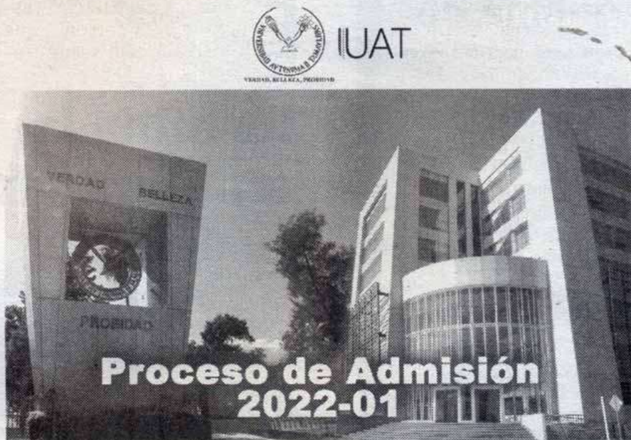
PARA DARSE de alta, la UAT ha púesto en marcha el registro virtual

De igual forma, las facultades y unidades académicas de todos los campus de la UAT en las zonas norte, centro y sur del estado di-