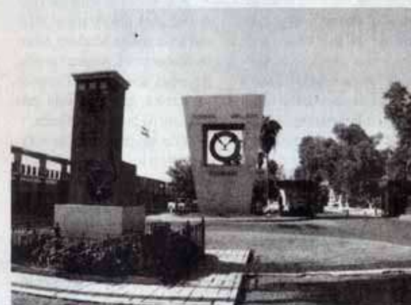
La máxima casa de estudios ofrece distintos programas de licenciatura y técnico superior universitario para el ciclo escolar 2022-1.

La publicación de los resultados de admisión está programada para el 16 de diciembre.