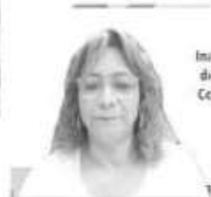
Im de Cg

La Directora de Trabajo Social de la UAT celebró la oportunidad de estrechar lazos que contribuyen a la internacionalización de la educación superior, y de avanzar en este proceso que pretende mejorar la dimensión internacional de la experiencia educativa universitaria con calidad y pertinencia.