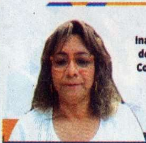
ina de Co

La Unidad Académica de Trabajo Social y Ciencias para el Desarrollo Humano (UATSCDH) de la Universidad Autónoma de Tamaulipas (UAT) puso en marcha el segundo proyecto de aprendizaje internacional colaborativo en línea, que se realiza con la Corporación Universitaria Minuto de Dios (UNIMINUTO) de Colombia.