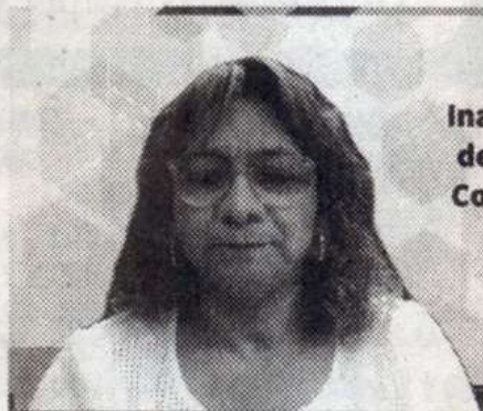
Ina de Co