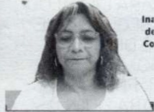
In de Co Foto • Staff • Expreso-La Razón

REFUERZA la UAT, colaboración internacional.